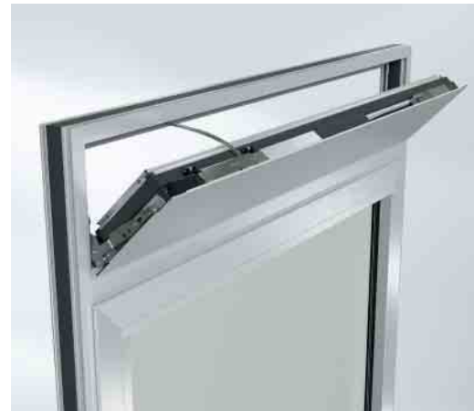
Die Lüftungsflügel AWS VV mit TipTronic Beschlag sind als Kipp-„Oberlicht“- und als Drehlösung verfügbar The AWS VV ventilation vents with TipTronic fittings are available as bottom-hung “toplight” and side-hung solutions

Schüco Lüftungsflügel AWS VV (Ventilation Vent) sind als opake Drehflügel in 300 mm, 250 mm und 170 mm Ansichtsbreite verfügbar. Mit dem umfangreichen Profilsortiment in den Systembautiefen von 65 bis 90 mm ist es Schüco gelungen eine hohe Flexibilität im Systemgeschäft anzubieten. Die bis Raumhöhe realisierbaren Drehflügel kombinieren schnelle Raumdurchlüftung mit hoher architektonischer Gestaltungsfreiheit. Im Sommer können die Drehflügel dauerhaft geöffnet bleiben. Die Flügel sind komfortabel zu bedienen und eignen sich ideal zur Kombination mit großen verglasten Elementen und Festverglasungen.