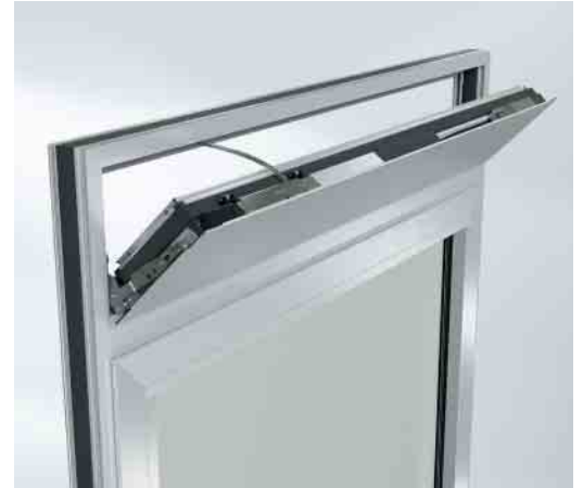
Die Lüftungsflügel AWS VV mit TipTronic Beschlag sind als Kipp-“Oberlicht“- und als Drehlösung verfügbar The AWS VV ventilation vents with TipTronic fittings are available as bottom-hung “toplight” and side-hung solutions

Schüco Lüftungsflügel AWS VV (Ventilation Vent) sind als opake Drehflügel in 300 mm, 250 mm und 170 mm Ansichtsbreite verfügbar. Mit dem umfangreichen Profilsortiment in den Systembautiefen von 65 bis 90 mm ist es Schüco gelungen eine hohe Flexibilität im Systemgeschäft anzubieten. Die bis Raumhöhe realisierbaren Drehflügel kombinieren schnelle Raumdurchlüftung mit hoher architektonischer Gestaltungsfreiheit. Im Sommer können die Drehflügel dauerhaft geöffnet bleiben. Die Flügel sind komfortabel zu bedienen und eignen sich ideal zur Kombination mit großen verglasten Elementen und Festverglasungen.